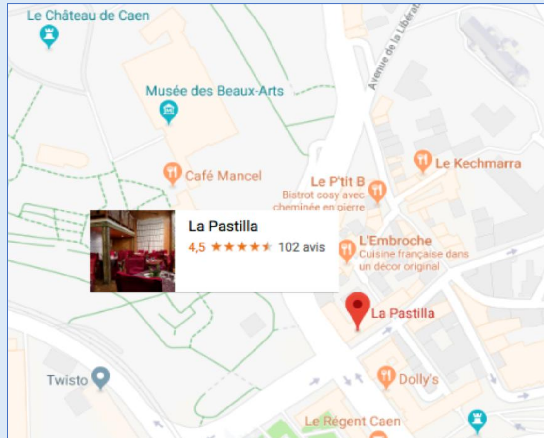
Restaurant « La Pastilla » 3 Rue Montoir Poissonnerie, 14000 Caen